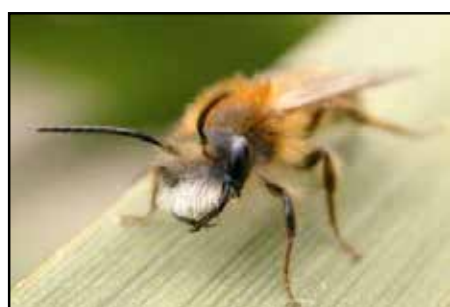
Mannetje Vosje met karakteristieke witte 'baard'

* heb je deze bij gespot? Graag ingeven op www.waarnemingen.be