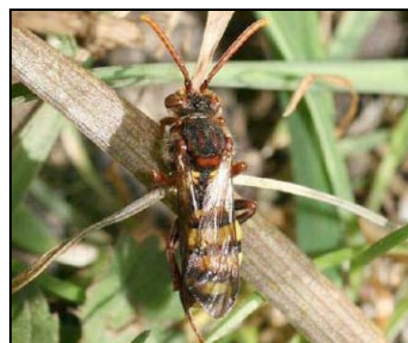
De Signaalwespbij heeft als enige gastheer het Vosje

Voor meer informatie contact : bijen@natuurpunt.be