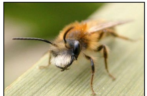
Mannetje Vosje met karakteristieke witte 'baard'