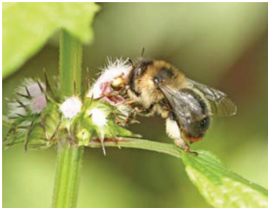
Vrouwtje met typerende oranje achterlijfspunt