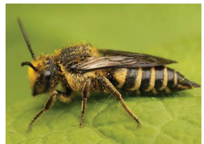
Vrouwtje Rosse kegelbij

Aculea is de Natuurpuntwerkgroep die zich bezig houdt met de studie van wilde bijen en wespen.