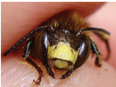
Mannetje Andoornbij met typerende gele koptekening