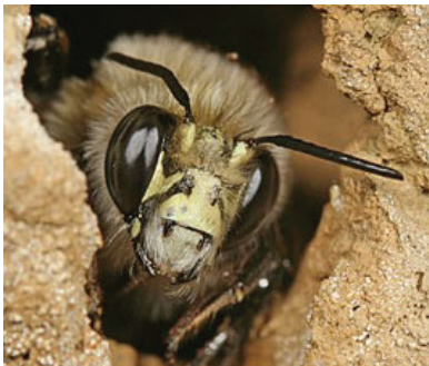
Mannetje Gewone sachembij: kop-tekening met meer zwart