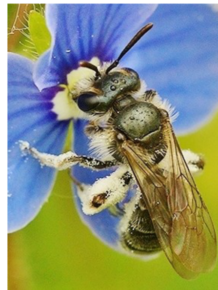
Vrouwtje Groene zandbij met kenmerkende blauwgroene metaalglans