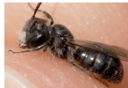
Mannetje Groene zandbij met metaalglans en wit kopschild