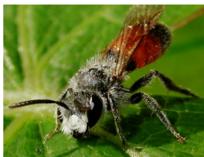
Mannetje Ereprijszandbij met wit kopschild