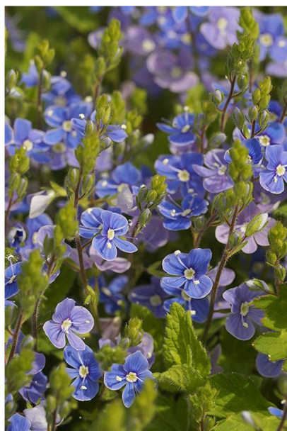
Gewone ereprijs in bloei