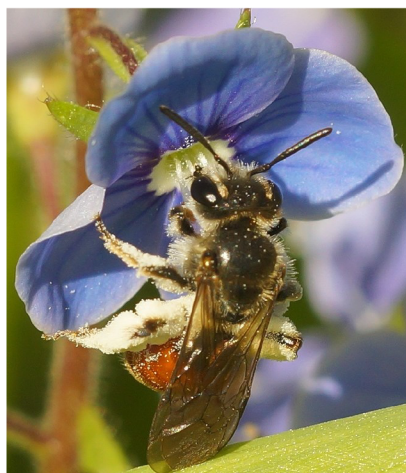
Vrouwtje Ereprijszandbij met rood achterlijf, witviltige groeven langs de ogen en wit stuifmeel van ereprijs aan de achterpoten.