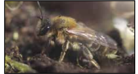
Vroege zandbij, gastheer van de Geelschouderwespbij

* Heb je deze bij gespot? Graag ingeven op www.waarnemingen.be