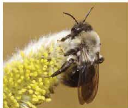
Vrouwtje bezoekt wilgenkatje

MAAK, INDIEN MOGELIJK, OOK FOTO'S. DIT VERGEMAKKELIJKT CONTROLE VAN DE WAARNEMINGEN