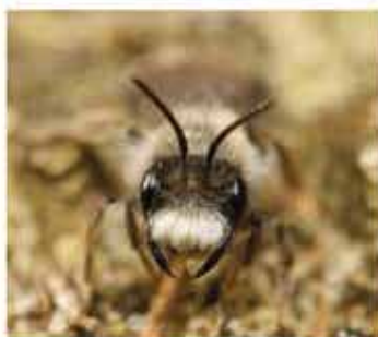
Mannetje met karakteristieke witte baard