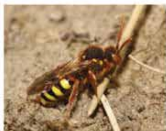
Nomada lathburiana vrouwtje