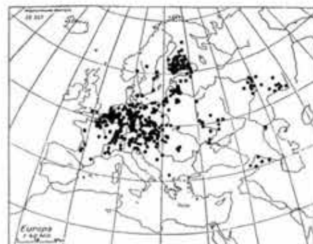
Verspreiding op wereldschaal (naar Gusenleitner & Schwarz 2002)